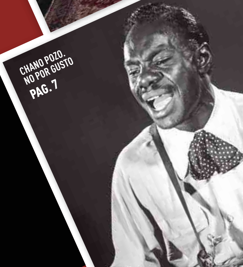
CHANO POZO. NO POR GUSTO PAG. 7