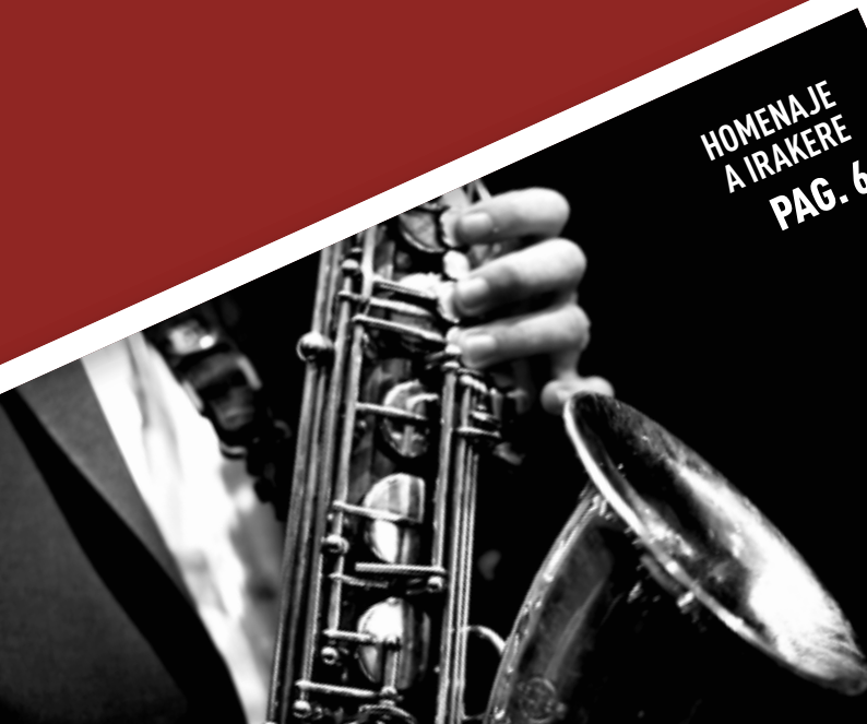
HOMENAJE A IRAKERE PAG. 6

35 FESTIVAL INTERNACIONAL JAZZ PLAZA 2020 DE LA HABANA A SANTIAGO