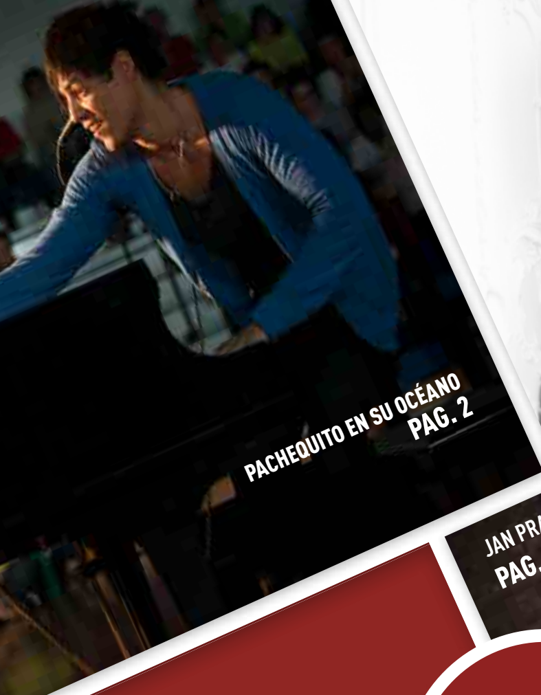
PACHEQUITO EN SU OCÉANO PAG. 2