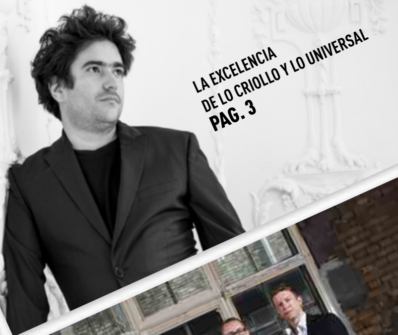
LA EXCELENCIA DE LO CRIOLLO Y LO UNIVERSAL PAG. 3