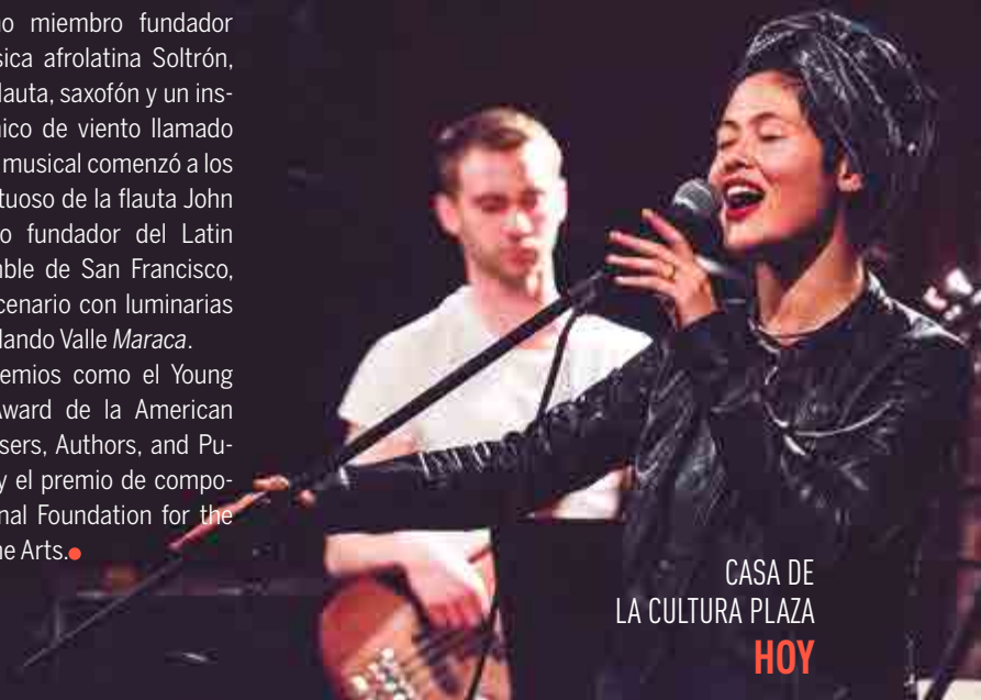
CASA DE LA CULTURA PLAZA HOY

Ha recibido premios como el Young Jazz Composer Award de la American Society of Composers, Authors, and Publishers (ASCAP) y el premio de composición de la National Foundation for the Advancement of the Arts. ●