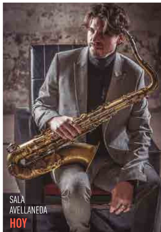
SALA AVELLANEDA HOY

Cuenta con siete producciones discográficas, siendo A feast of friends (2015) y Rebirth (2016) sus más recientes. ●